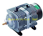
Compresseur Pompe à air Piston aquarium bassin ACO-380 Hailea